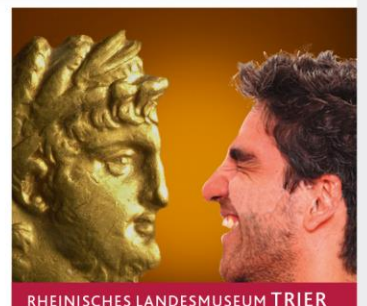
RHEINISCHES LANDESMUSEUM TRIER