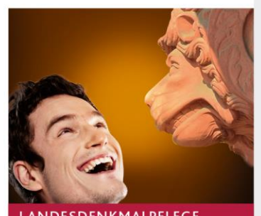
LANDES DENK MAL PFLEGE