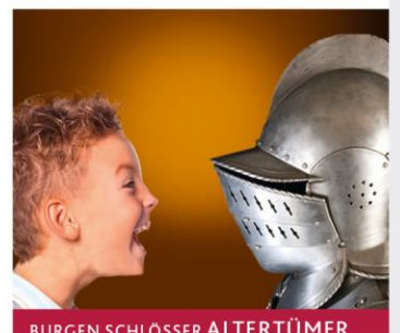
BURGEN SCHLÖSSER ALTERTÜMER